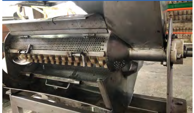
b. Rotor con agitadores