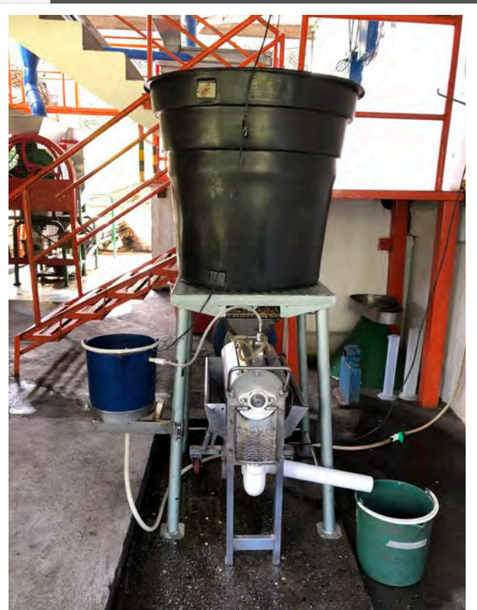
Figura 1. Ecomill® LH300, nuevo equipo para el lavado del café.