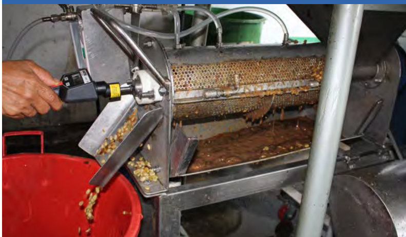
a. Lavador operando a 300 r min -1 y 0,7 L kg -1 de c.p.s.