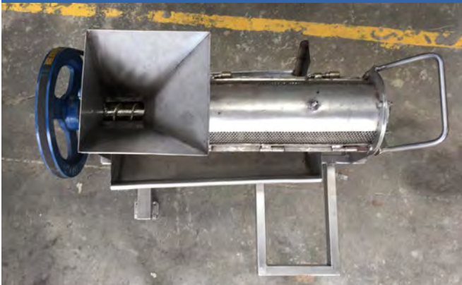
c. Tornillo sinfín del alimentador