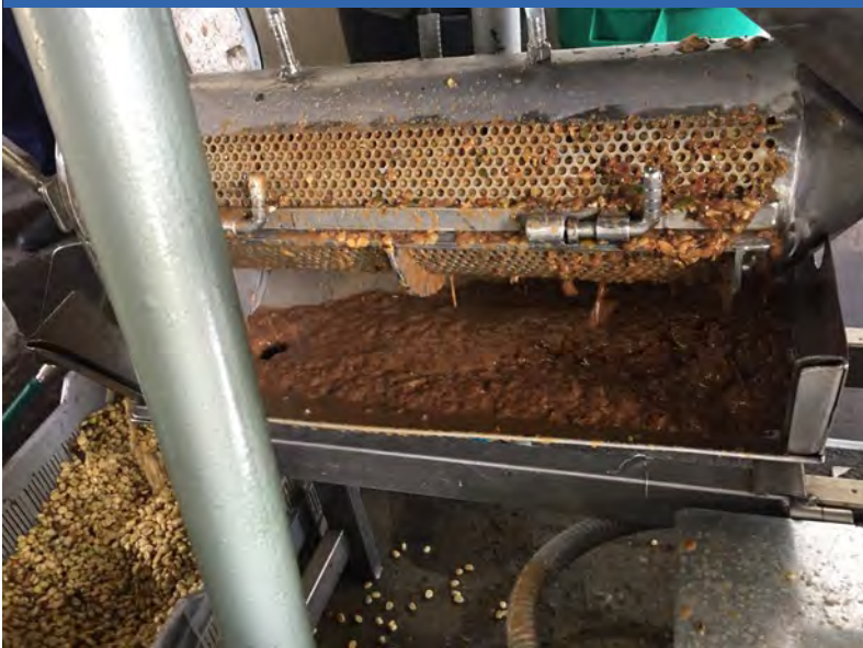
a. Expulsión de las aguas residuales de lavado