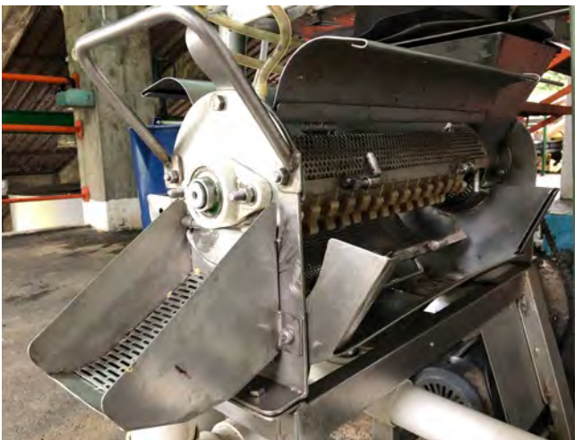
Figura 4. Dispositivo para separar agua de lavado de los granos de café.

En la Tabla 1 se presentan las condiciones óptimas de operación del equipo y en las Figuras 5a y 5b se observa la operación del lavador y el aspecto del café beneficiado, con un volumen específico de agua de 0,7 \text{ L kg}^{-1} de c.p.s. y velocidad de giro del rotor de 300 \text{ r min}^{-1} .