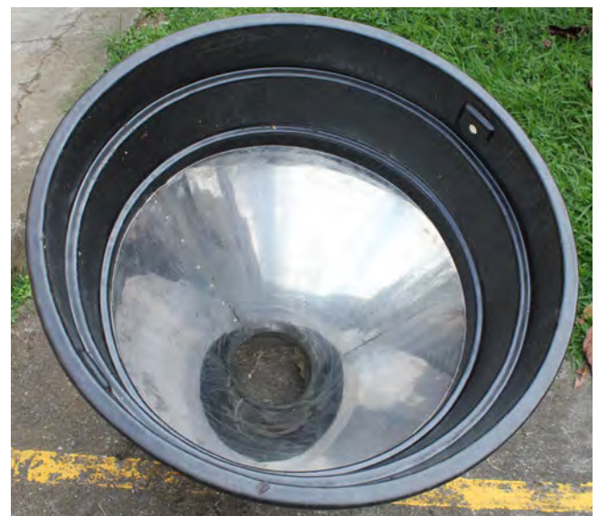
Figura 2. Cono truncado utilizado en el tanque de fermentación para permitir la descarga del café por gravedad.