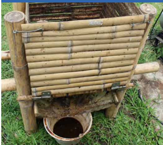
a. Drenajes después de 24 h