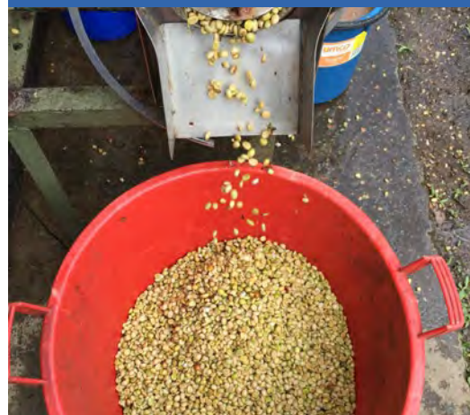
b. Café lavado