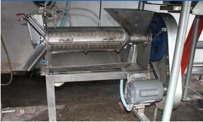
a. Vista general del lavador horizontal